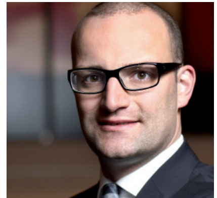
Jens Spahn (CDU): „Der Auftrag im Pflegeberuf lautet: Dienst am Menschen – nicht an den Akten.“

Bei dieser Pflegereform muss der Blick auf die Bedürfnisse der Menschen, des Patienten, seiner Angehörigen und auch